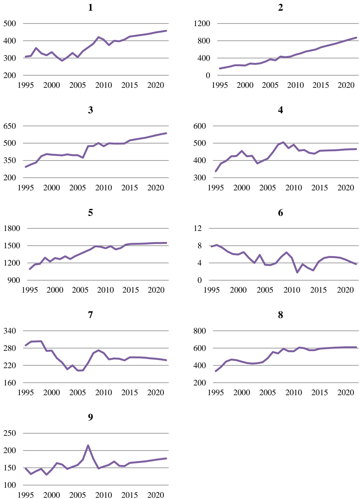
Rysunek 3. Liczba pracujących (w tys. osób) w przekroju wielkich grup zawodowych w usługach rynkowych w latach 1995-2013 (prognoza na lata 2014-2022)