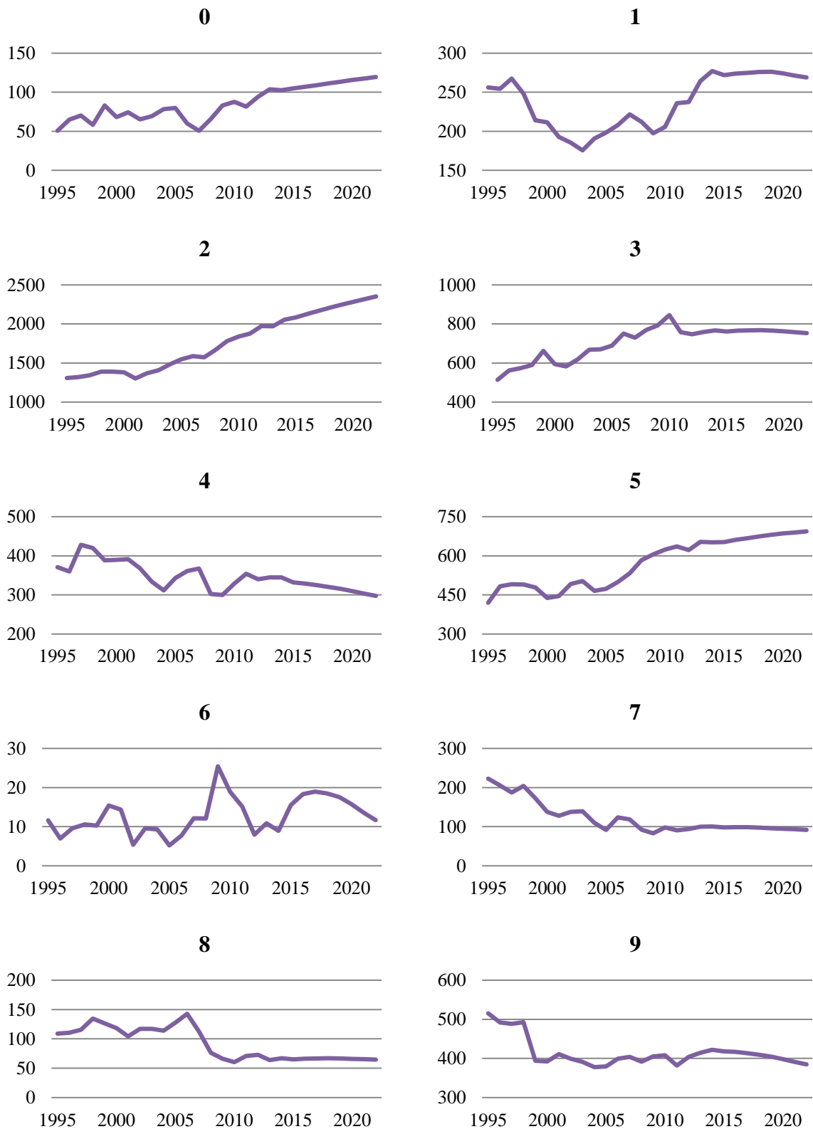
Rysunek 4. Liczba pracujących (w tys. osób) w przekroju wielkich grup zawodowych w usługach nierynkowych w latach 1995-2013 (prognoza na lata 2014-2022)